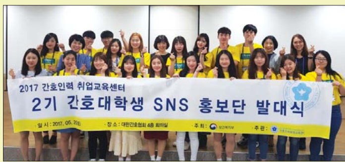
대한간호협회 운영 간호인력취업교육센터의 활동을 홍보하기 위한 '2기 간호대학생 SNS 홍보단' 발대식이 열렸다.