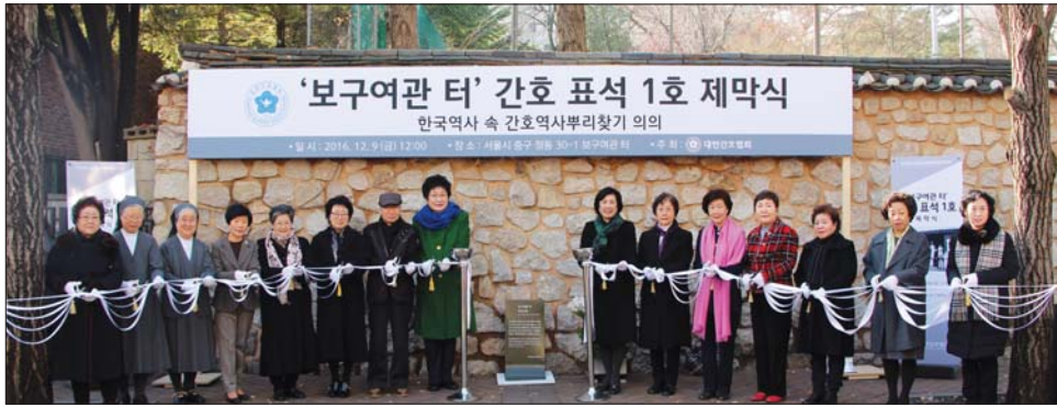
간호 표석 1호는 '보구여관 터'인 서울 중구 정동 30-1에 설치됐다. 제막식 테이프 커팅 모습.