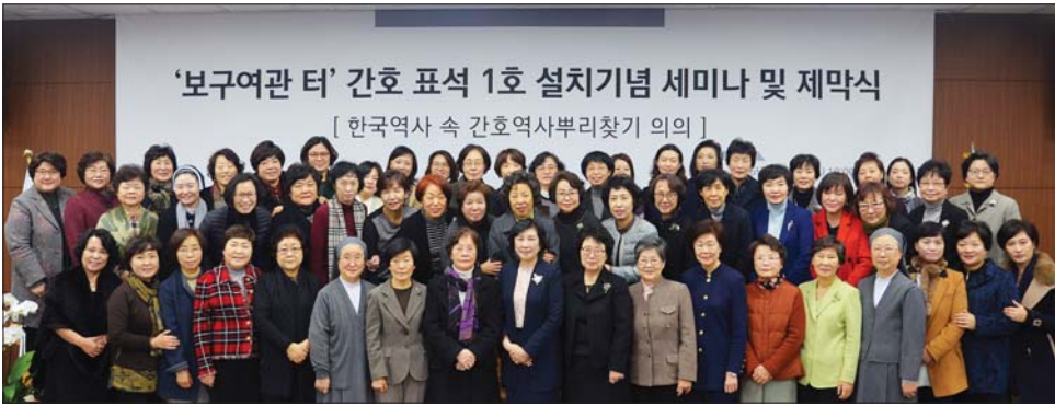
간호역사뿌리찾기사업으로 추진해 결실을 맺은 간호 표석 1호 설치를 기념하는 세미나가 열렸다.