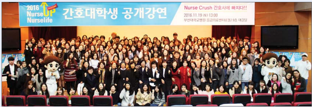
대한간호협회는 간호대학생을 위한 공개강연을 부산에서 개최했다.